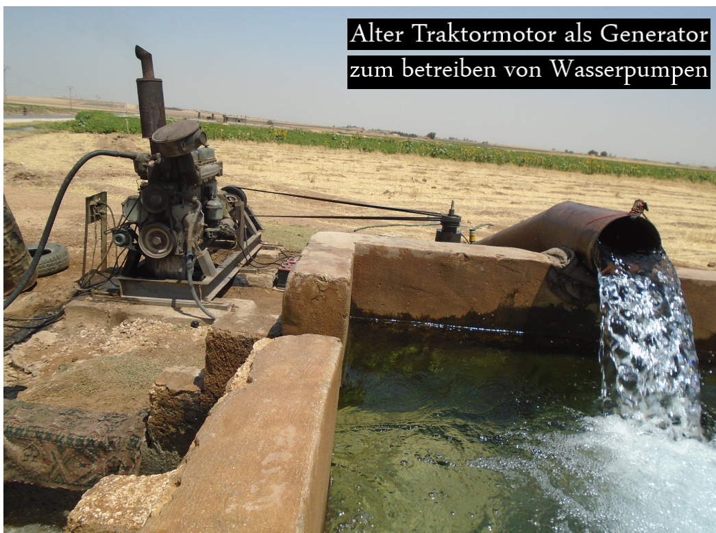
Alter Traktormotor als Generator zum betreiben von Wasserpumpen

Die Selbstverteidigungseinheiten arbeiteten im Kampf gegen Daesh mit verschiedenen Militärmächten zusammen. Die Gefahr ist gross, dass Rojava für Machtinteressen und Propagandazwecke der westlichen Mächte vereinnahmt werden kann. Es mag sein, dass die Luftschläge gegen Daesh eine